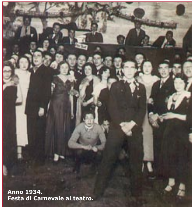
Anno 1934. Festa di Carnevale al teatro.