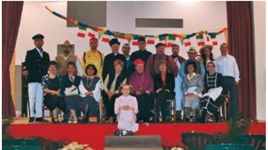
La Compagnia "Dei Raccattati".

Una Compagnia che solo per vezzo si è chiamata "DEI RACCATTATI", senza dare a questo termine alcun senso riduttivo o negativo, col solo intento di fornire l'idea di un reclutamento casuale di persone della più svariata estrazione culturale e lavorativa e senza alcuna esperienza teatrale.