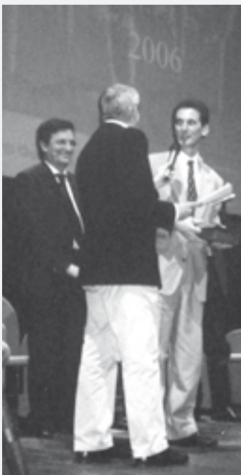
Un momento della premiazione.

La premiazione è stata effettuata dal Presidente della Giunta Regionale Claudio Martini