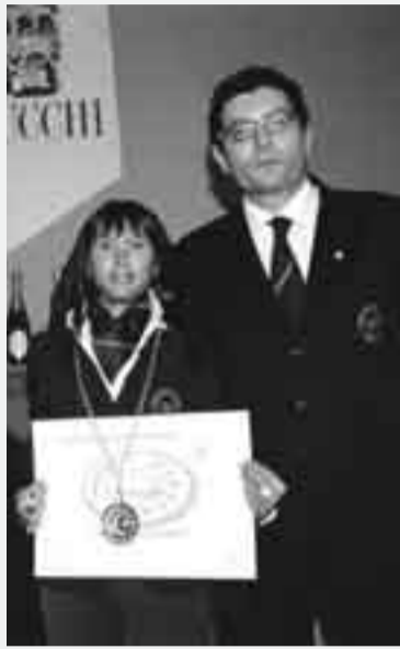
La consegna del diploma e del Tastvin.

Se è vero che nella degustazione di un vino si esprime la conoscenza, la storia, l'arte e la cultura della terra che lo ha pro-