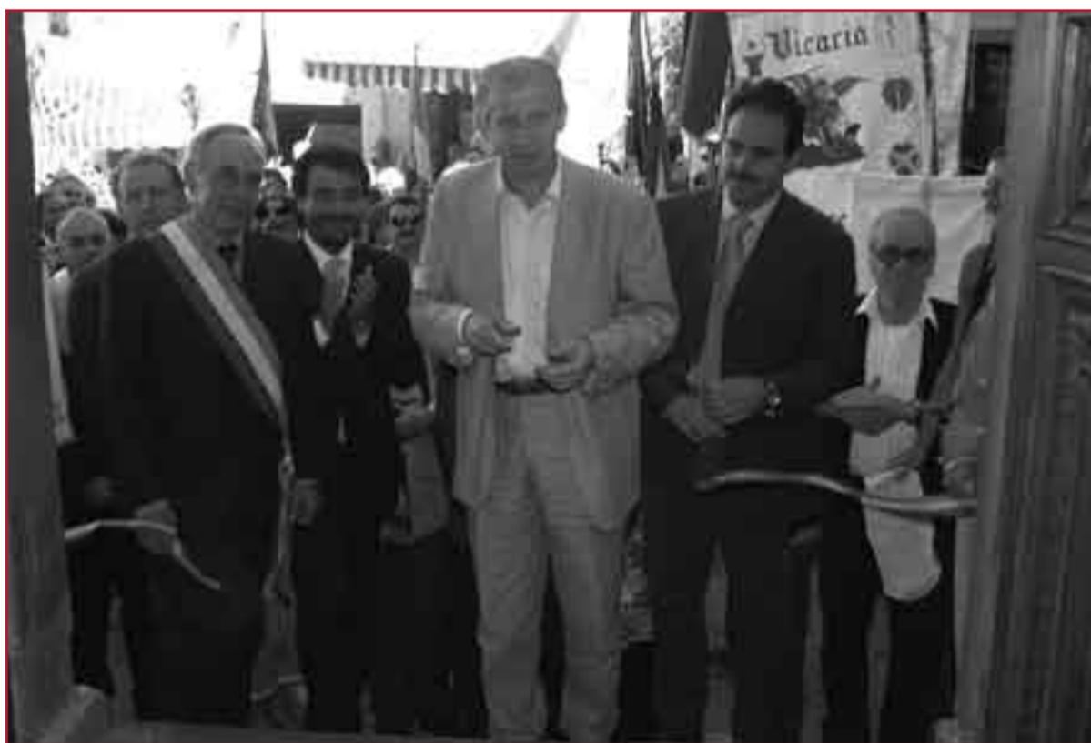
Un momento della cerimonia.