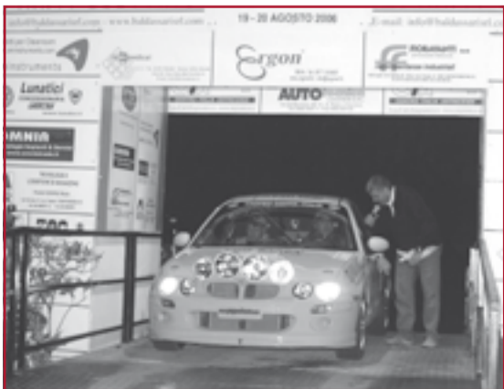
Un momento di una gara.