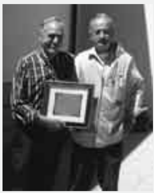
Un momento della cerimonia.

Al saluto dell'Amministrazione e dei colleghi si aggiunge naturalmente quello della nostra Redazione