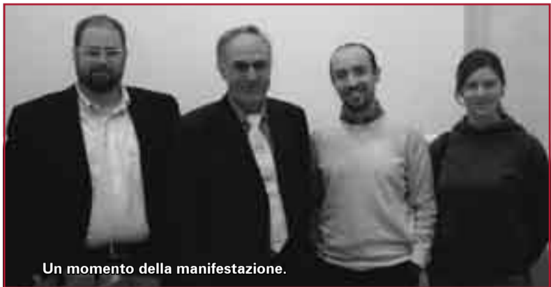
Un momento della manifestazione.

Il Comune di Coreglia, in particolare l'assessorato all'ambiente, ha recepito l'invito di Legambiente Onlus ed ha aderito alla IV edizione della manifestazione Voler bene all'Italia. Sabato 5 maggio presso il centro per la didattica - ambientale nella frazione di Ghivizzano (vicino alla stazione FF.SS.) alle ore 10 si è svolta la manifestazione "Voler bene all'Italia, Festa nazionale della PiccolaGrandItalia". La manifestazione, organizzata dal Comune di Coreglia con Legambiente, ha avuto la finalità di richiamare l'attenzione sui piccoli comuni. Tema della giornata un argomento di grande attualità: i cambiamenti climatici. E' intervenuto alla manifestazione il Dr