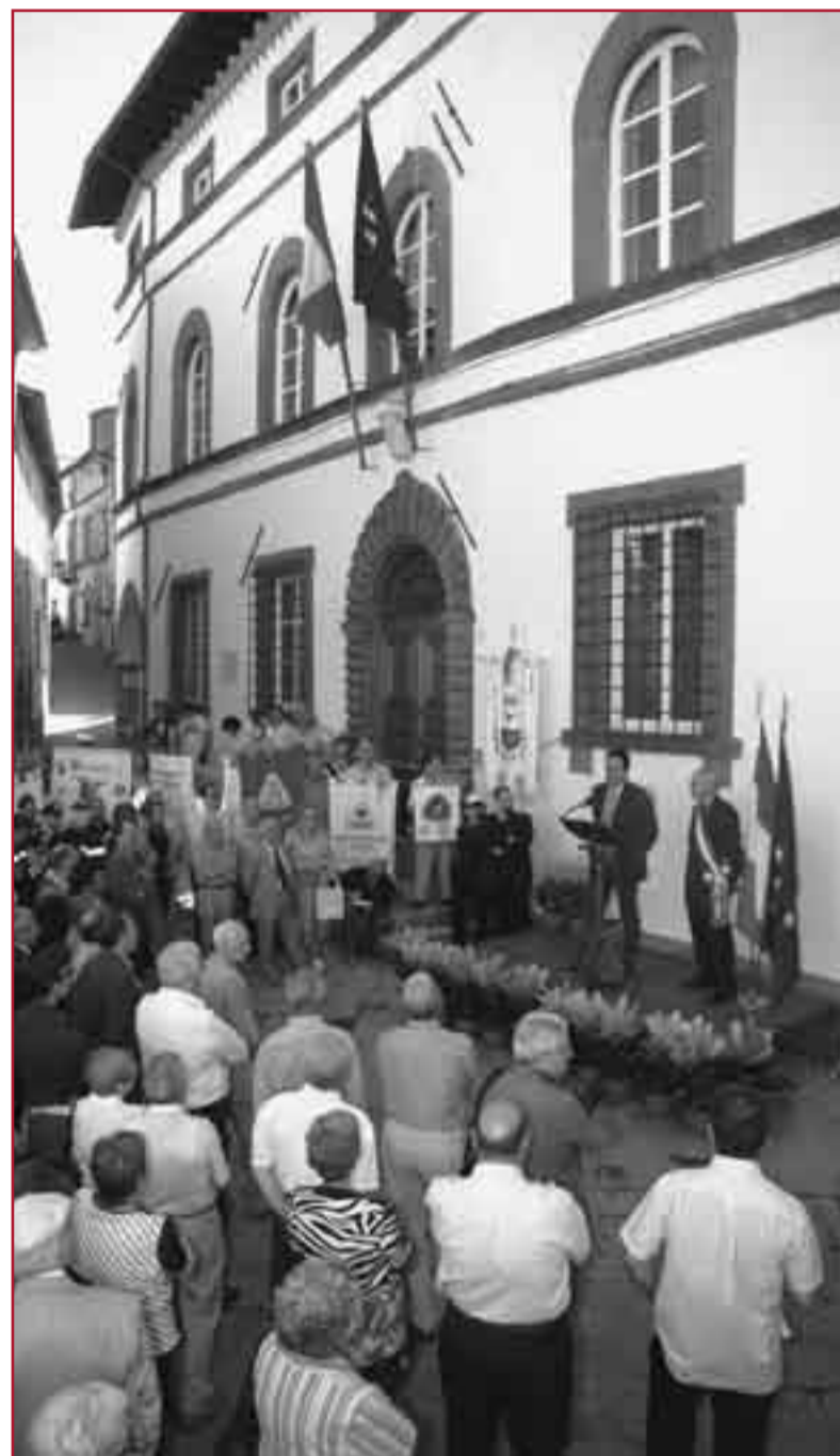
Un momento della cerimonia.