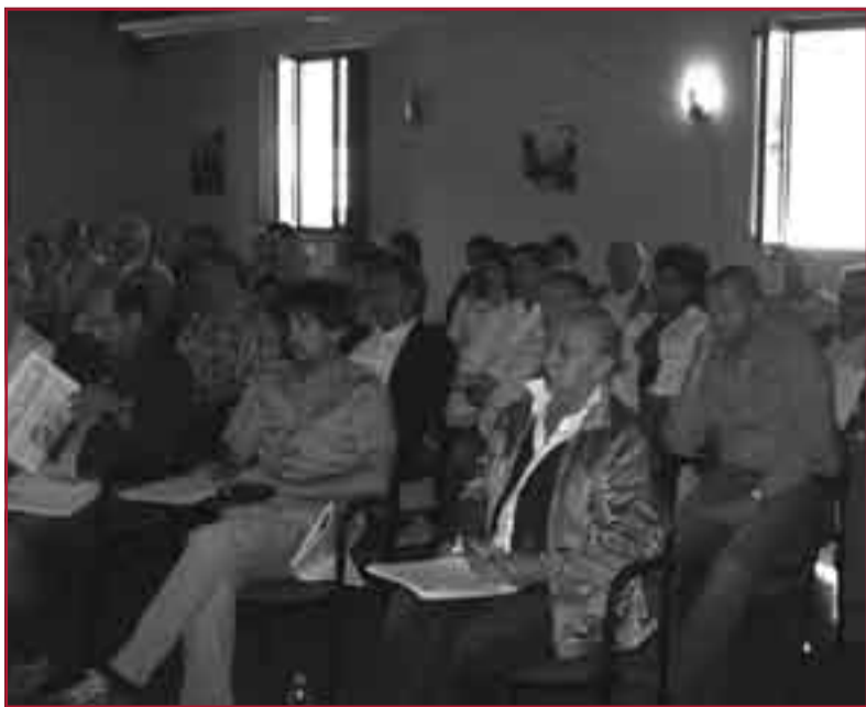
Alcuni dei numerosi partecipanti.

Un successo, la giornata di sensibilizzazione per le imprese organizzata nel maggio scorso dal comune di Coreglia, in collaborazione con Ecol Studio e Studio R.M., presso la sede comu-