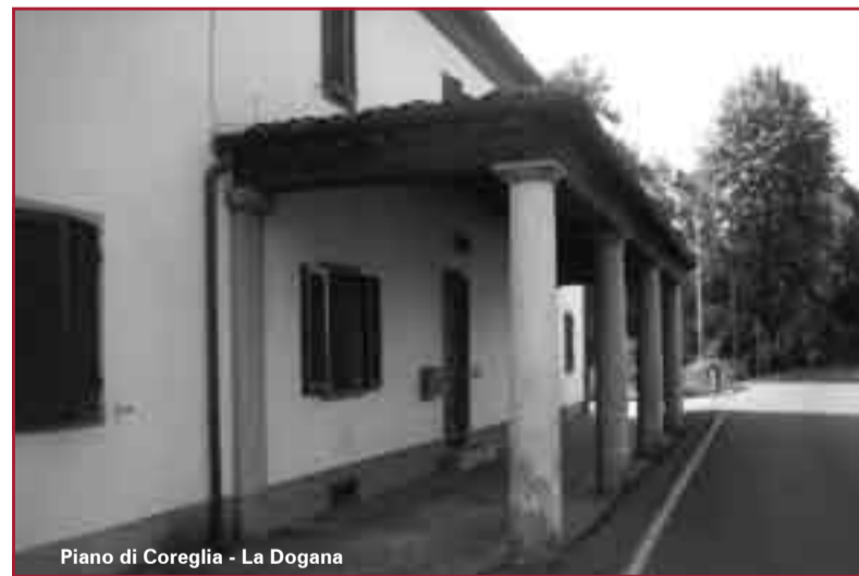
Piano di Coreglia - La Dogana

Spesso dalle pagine dei giornali, apprendiamo di episodi di bullismo nelle scuole che ci fanno riflettere su come gli insegnanti non riescano a "frenare l'irruenza" dei giovani. Per contro riportiamo il racconto di una alunna, sui metodi "educativi" praticati negli anni della sua infanzia, per attirare "l'attenzione" degli alunni. Oggi come allora non mancano gli spunti di riflessione.