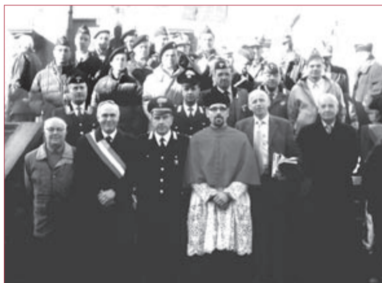
Un momento della cerimonia.

L'arma dei carabinieri era rappresentata dal Comandante