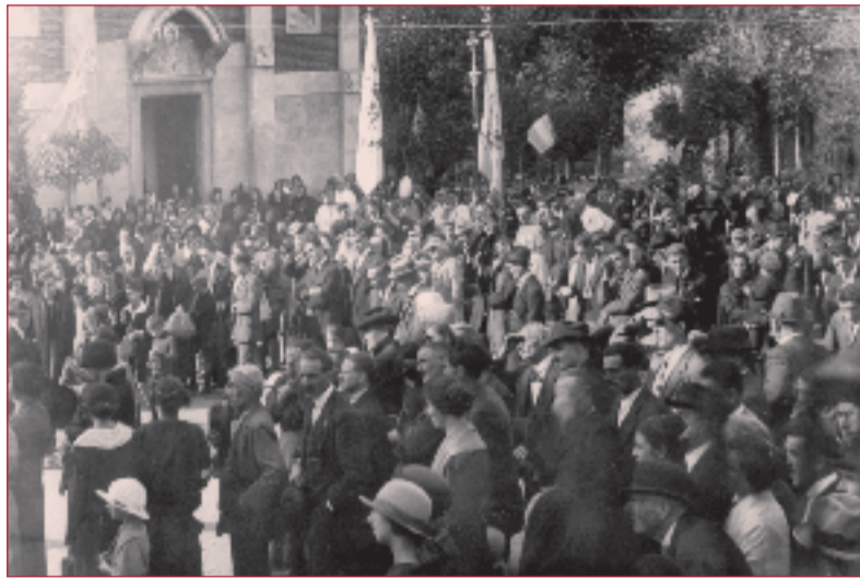
L'inaugurazione della facciata della Chiesa.

E' qui che inizia l'avventura e la grande opera di Don Antonio Puccini. In verità l'ampliamento ebbe inizio nel 1897 sotto la guida dell'Economo spirituale Don Adolfo Della Santina e di Mons. Benedetto Bernardini (fondatore del Seminario Bernardini di Lucca), ma è nel 1900 che ebbe il suo impulso ed è grazie all'opera di Don Puccini, dei parrocchiani presenti e da quelli all'estero, che ebbe termine nell'anno 1904. Nel dicembre di quell'anno fu fatta la solenne inaugurazione con grandiosi festeggiamenti resi ancora più solenni da numerosi