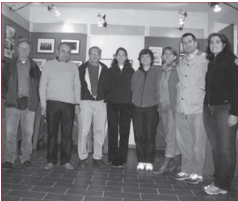
La famiglia Bernardini con alcuni parenti ed il Direttore del Museo.

I Signori Bernardini, visibilmente commossi per il legame che unisce la storia della loro famiglia a quella della Museo, sono rimasti entusiasti sia per l'accoglienza ricevuta che per quanto hanno potuto ammirare.