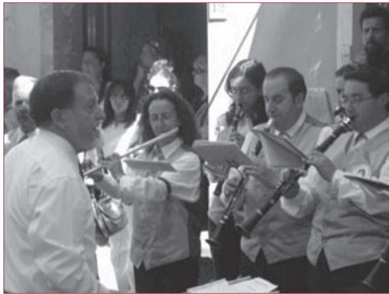
Il Maestro Laurence Wilde ed alcuni strumentisti.

Il corpo bandistico è aumentato numericamente negli ultimi tempi e questo grazie al rientro di alcuni elementi e alla scuola che come nel lontano 1882 continua ogni anno a istruire allievi. Ma un problema esiste per la Banda di Coreglia, si tratta di un motivo di crisi ancora