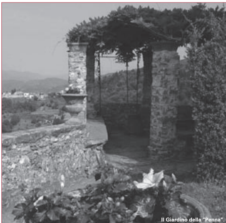
Il Giardino della "Penna".