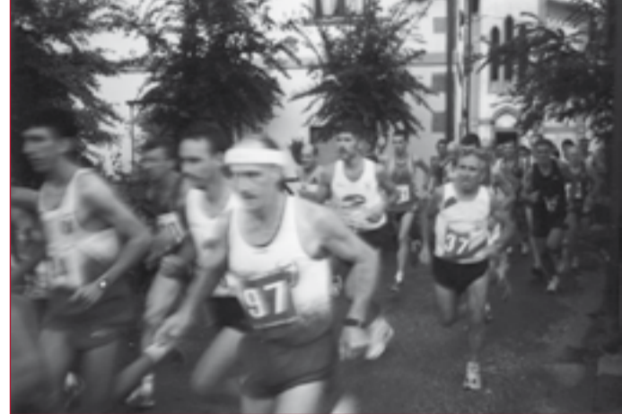
Un momento della corsa podistica.

Il giorno di San Lorenzo, Giovedì 10 Agosto, si è svolta l'attesa corsa podistica competitiva in collaborazione con il G.S. Orecchiella Garfagnana, con i giudici Fidal di Lucca sempre molto attenti e competenti, ed anche con i CB del Barghigiano di servizio con il locale gruppo Marciatori Fratres ed il circolo parrocchiale. E' stata una bella corsa ed anche bene organizzata con ricchi premi per i vincitori, ma anche per coloro che non correvano ma camminavano