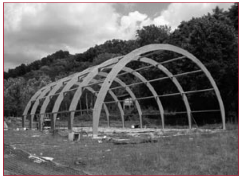
Nelle foto alcune immagini del cantiere. In particolare l'intelaiatura portante ad arco della nuova struttura in legno lamellare.