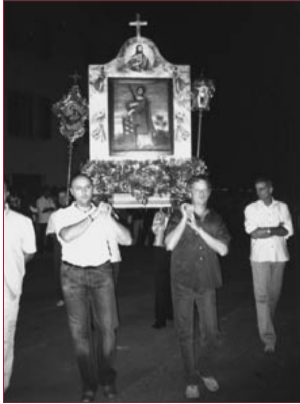
Un momento della processione di S. Lorenzo.