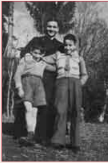
Cristo regni! Sempre!