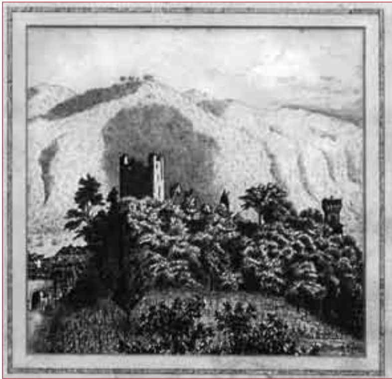
La riproduzione dell'opera.

La pittura, fra le più antiche della torre stessa, è un importante documento storico che ci aiuta a ricostruire l'evoluzione del castello nel corso dei secoli.