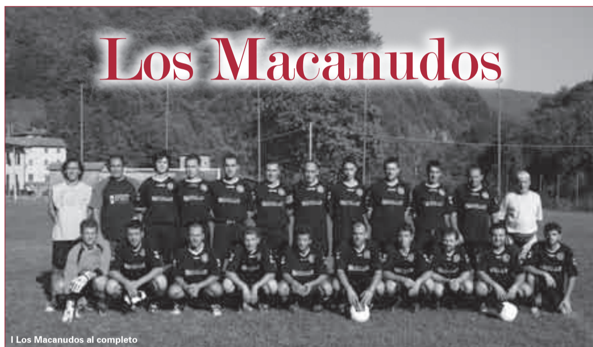
I Los Macanudos al completo