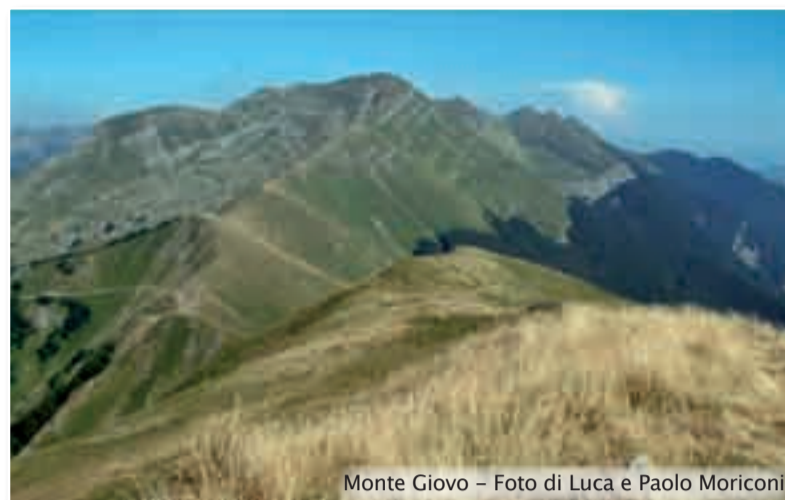
Monte Giovo

D'altronde, un altro elemento toponomastico sta a provare che tutta la valle era impegnata