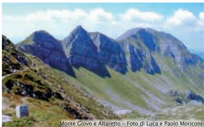
Monte Giovo e Altaretto

NOMINATO DAL CONSIGLIO COMUNALE IL NUOVO REVISORE DEI CONTI