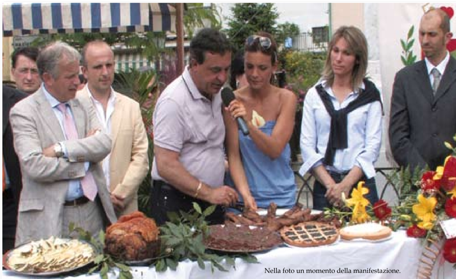
Nella foto un momento della manifestazione.