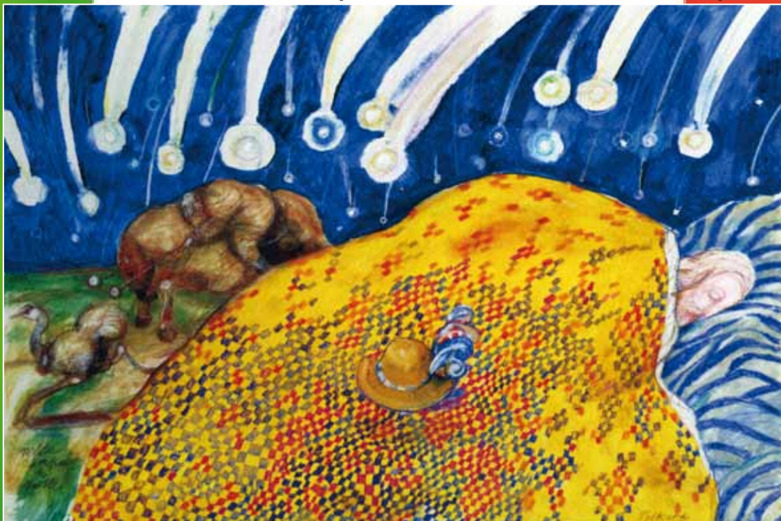
Opera realizzata da Antonio Possenti in occasione della manifestazione Coreglia ricorda Garibaldi 25 Agosto 2007

Io son fatto per rompere i coglioni a mezza umanità, e l'ho giurato