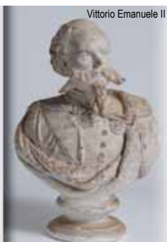
Vittorio Emanuele II