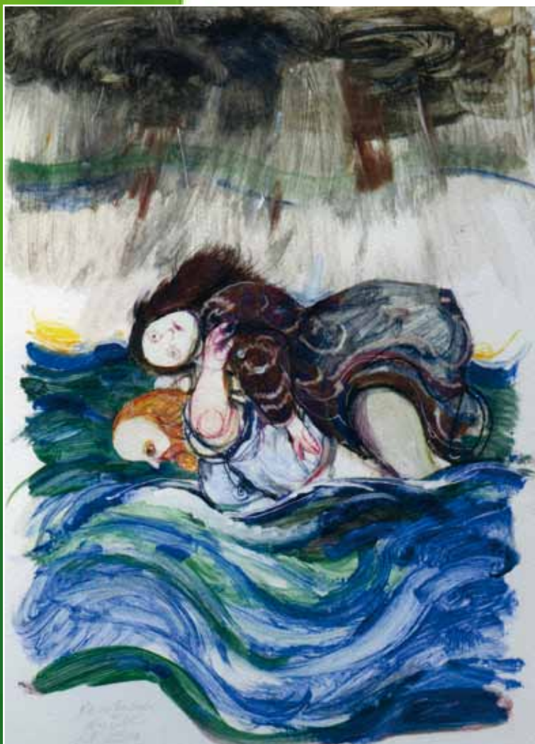
Opera realizzata da Antonio Possenti in occasione della manifestazione Coreglia ricorda Garibaldi 25 Agosto 2007

La salutai finalmente, e le dissi: "Tu devi esser mia". Avevo stretto un nodo, sancito una sentenza, che la sola morte poteva infrangere