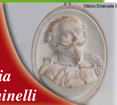
Vittorio Emanuele II