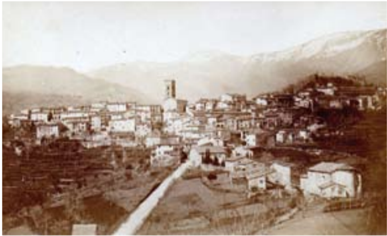
Coreglia di fine Ottocento