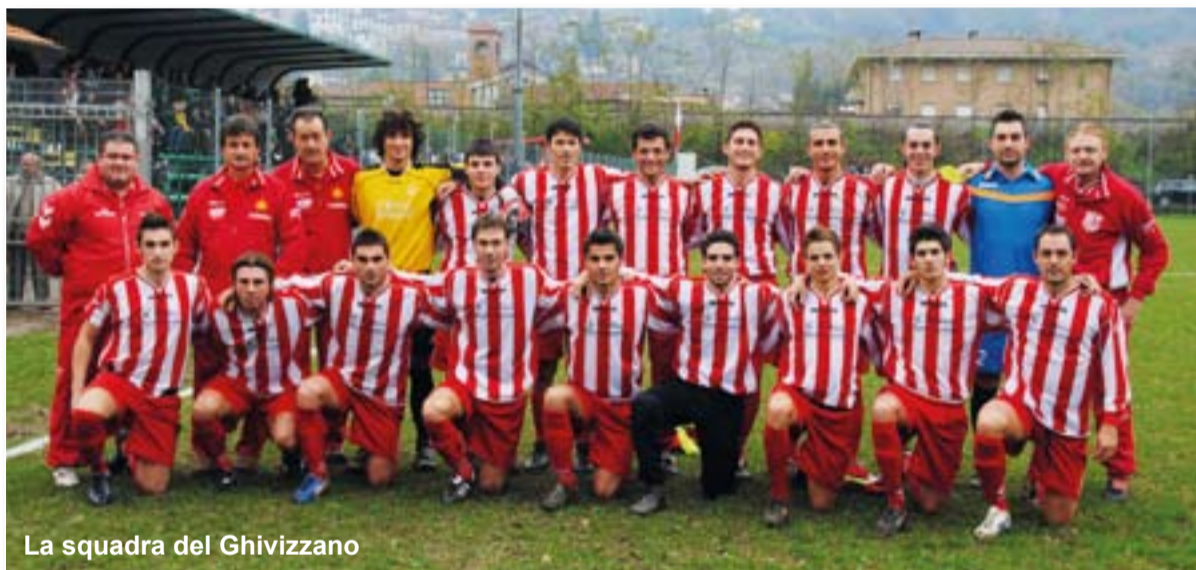
La squadra del Ghivizzano

ben altre. Un capitolo a parte va aperto per il calcio giovanile, che stenta a decollare ma che vede due formazioni Juniores scendere in campo ogni sabato. Quella del Ghivizzano, con risultati apprezzabili visto che si trova a centro classifica, e quella del Piano di Coreglia, complesso molto giovane e ancora acerbo per il quale, già il fatto di cogliere una vittoria, è stata un'impresa difficile e sofferta. Protagoniste del campionato amatoriale infine Coreglia Los Macanudos e Piano di Coreglia Toscopaper, entrambe in lotta per il successo del cosiddetto campionato Dilettanti 2a serie, dove si sono sfidate nel derby d'andata giocato al Piano e terminato con un rocambolesco tre a tre, e questo è tutto dire su come sia stato emozionante e combattuto, a conferma dell'equilibrio che regna in questo tipo di tornei.