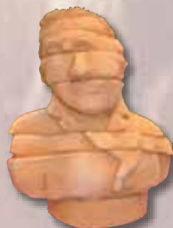
Caprini Martini Fano