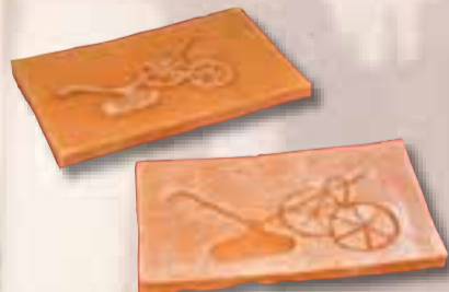
Duranti Viola Carrubba Costanza Firenze