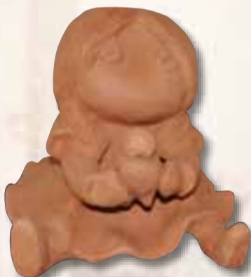
Corso Claudia Lucca