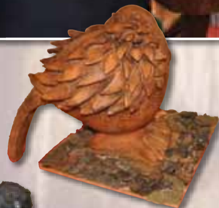
Picone Filomena Lucca