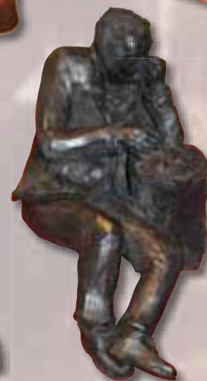
Brandimarte Ado Ascoli Piceno