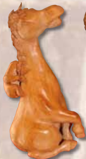
Pignati Carola Porto San Giorgio (EM)