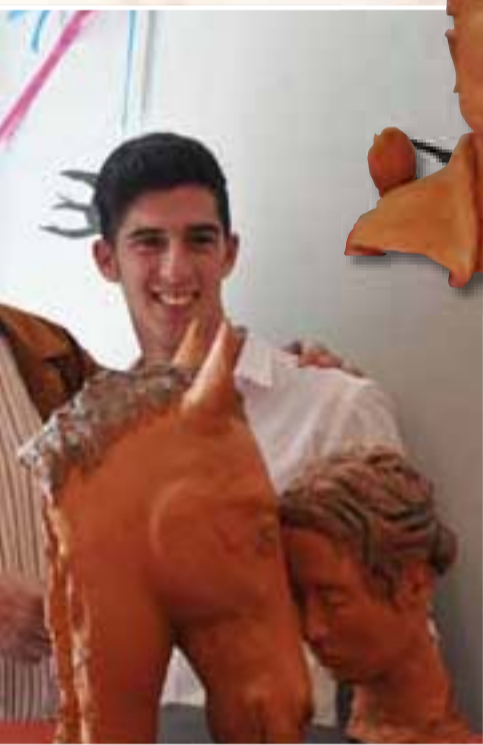
La premiazione del vincitore