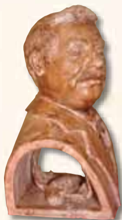
Alibrio Federico Palazzolo Acreide (SR)