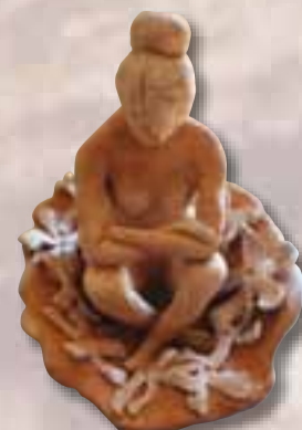
Ancillotti Irene Firenze