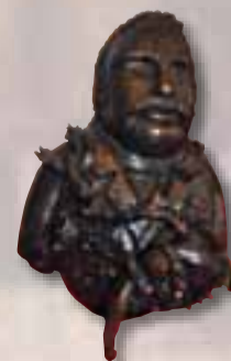
Sangervasi Agnese Fano