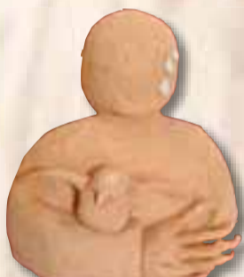
Cavaliere Giada Fano