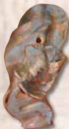
Piazzolla Antonella Cerignola