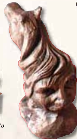
Bellini Irene Guidizzolo