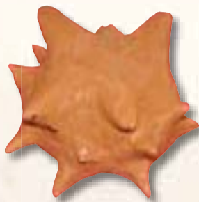
Shkallà Kejsi Reggio Emilia