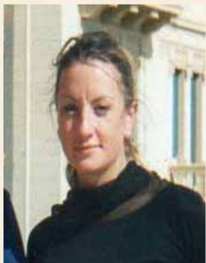
La figlia di Nicola