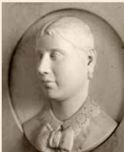
La madre di Cesarino