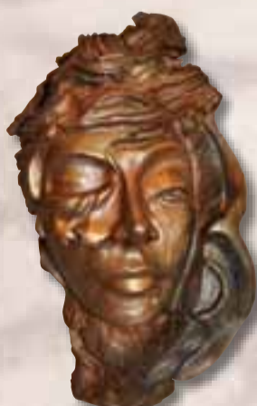
Di Foggia Alfonso Cerignola