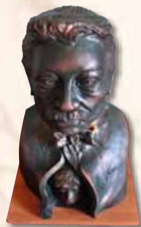
Grasso Pierpaolo Benevento