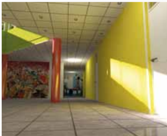
Rendering degli interni scuola Piano di Coreglia

Sempre a Coreglia, presso il campo sportivo, a seguito della frana causata dagli eventi alluvionali del 2011 che aveva danneggiato l'area a verde attrezzata a corredo dell'impianto sportivo, grazie ai fondi messi a disposizione dalla Regione Toscana nell'ambito del Piano di Sviluppo Rurale è stato