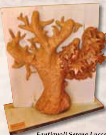
Fantignoli Serena Lucca